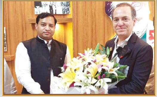
গাজীপুর সিটি কর্পোরেশনের নগর ভবনে ইতালীর রাষ্ট্রদূত কে শুভেচ্ছা জানান মাননীয় মেয়র