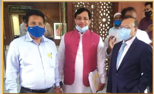
২০২০-২০২১ অর্থ বছরে ২৭তম একনেক সভা শেষে মাননীয় স্থানীয় সরকার পল্লী উন্নয়ন ও সমবায় মন্ত্রণালয়ের মাননীয় মন্ত্রী, সচিব ও মেয়র মহোদয়