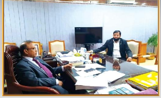
গাজীপুর সিটি কর্পোরেশনের উন্নয়নমূলক পরিকল্পনায় একান্তে মাননীয় স্থানীয় সরকার মন্ত্রী ও মাননীয় মেয়র