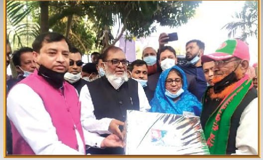
বীর মুক্তিযোদ্ধাদের সংবর্ধনা ও সম্মাননা অনুষ্ঠানে মাননীয় মন্ত্রী ও মাননীয় মেয়র