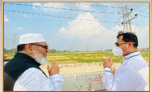
গাজীপুর সিটি কর্পোরেশনের উন্নয়নমূলক একান্ত আলোচনায় মাননীয় মুক্তিযুদ্ধ বিষয়ক মন্ত্রী ও মাননীয় মেয়র