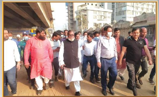
গাজীপুর সিটি কর্পোরেশনের অঞ্চল-৭ (কোনাবাড়ী) এর বিভিন্ন উন্নয়ন মূলক কাজ পরিদর্শনে মাননীয় মুক্তিযুদ্ধ বিষয়ক মন্ত্রী ও মাননীয় মেয়র