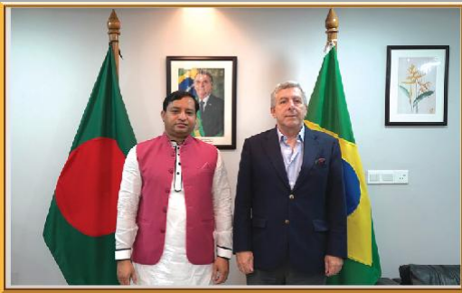
গাজীপুর সিটি কর্পোরেশনের মাননীয় মেয়র ও ব্রাজিলের রাষ্ট্রদূতের সৌজন্য সাক্ষাতে