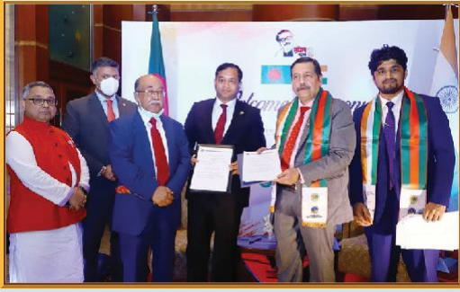
ভারতীয় হাই কমিশন এর আমন্ত্রণে সম্মাননা অনুষ্ঠানে মাননীয় মেয়র