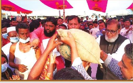
গাজীপুর সিটি কর্পোরেশনের অঞ্চল-৭ (কোনাবাড়ী) আওতনে পুড়ে যাওয়া ক্ষতিগ্রস্থদের মাঝে ত্রাণ বিতরণ