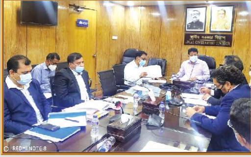
স্থানীয় সরকার বিভাগে গুরুত্বপূর্ণ বৈঠকে মাননীয় মেয়র মহোদয়