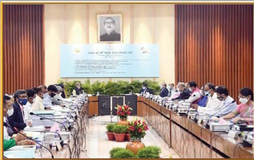
২০২০-২০২১ অর্থ বছরে ২৭তম একনেক সভায় মাননীয় মেয়র মহোদয়