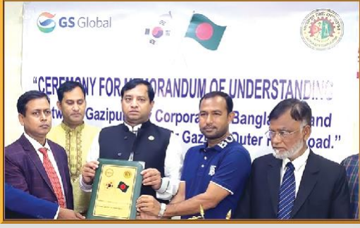
গাজীপুর সিটি কর্পোরেশন ও জিএস গ্লোবাল (কোরিয়া) এর মধ্যে উন্নয়নমূলক কাজের চুক্তি স্বাক্ষর অনুষ্ঠান