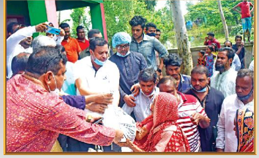
গাজীপুর সিটি কর্পোরেশনের বন্যা দুর্যোগ কবলিত এলাকায় ত্রাণ বিতরণ