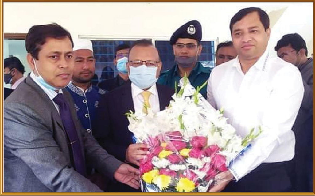
পাজীপুর সিটি কর্পোরেশনের উন্নয়ন মূলক কাজ পরিদর্শনে আগত স্থানীয় সরকার পল্লী উন্নয়ন ও সমবায় মন্ত্রণালয়ের মাননীয় মন্ত্রী-কে শুভেচ্ছা জানান মাননীয় মেয়র মহোদয়