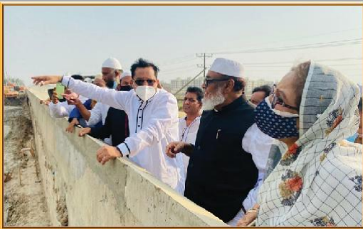
গাজীপুর অঞ্চল-১ (টঙ্গী) এর বনমালা রোড এর উন্নয়নমূলক কাজের পরিদর্শনে মুক্তিযুদ্ধ বিষয়ক মন্ত্রণালয়ের মাননীয় মন্ত্রী গাজীপুর-৫ আসনের মাননীয় এমপি ও মাননীয় মেয়র