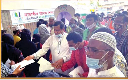
করোনা কালীন সময়ে পবিত্র ঈদ-উল ফিতর উপলক্ষে গার্মেন্টস কর্মীদের ঈদ বোনাস প্রদান