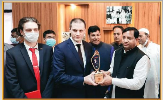
গাজীপুর সিটি কর্পোরেশনের নগর ভবনে রাশিয়া রাষ্ট্রদূত কে শুভেচ্ছা জানান মাননীয় মেয়র