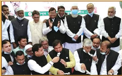
মুজিব শতবর্ষ উদ্‌যাপন উপলক্ষ্যে আয়োজিত অনুষ্ঠানে মাননীয় মেয়র, যুব ও ক্রীড়া প্রতিমন্ত্রী