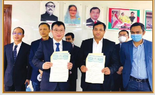
গাজীপুর সিটি কর্পোরেশন ও জাপানের একটি প্রতিষ্ঠানের সাথে চুক্তি স্বাক্ষর অনুষ্ঠানে মাননীয় মেয়র