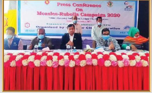
বঙ্গভাঙ্গ অভিটরিয়ামে প্রেস কনফারেন্স ও হাম রুবেলা ক্যাম্পেইন উদ্বোধন অনুষ্ঠানে মাননীয় মেয়র