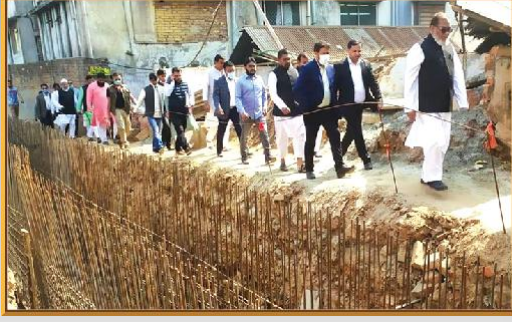
গাজীপুর সিটি কর্পোরেশনের উন্নয়ন মূলক কাজ পরিদর্শনে মাননীয় মন্ত্রী, ডিসি ও মাননীয় মেয়র